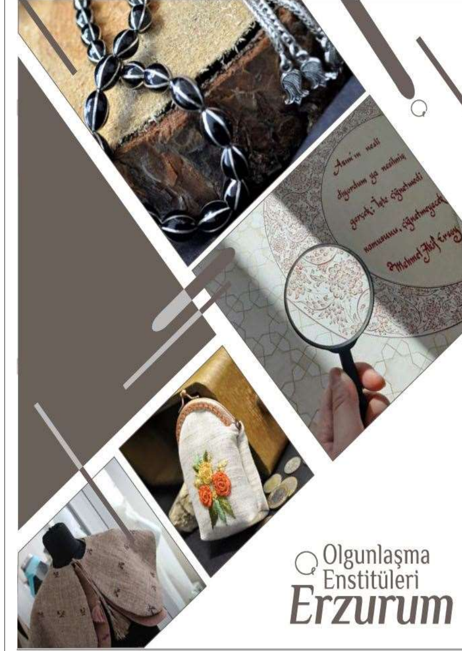
Kurum tanıtım kitapçığı.