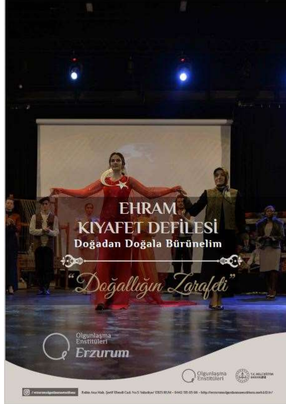
Doğadan Doğala Bürünelim projesi kapsamında hazırlanan «Doğallığın Zarafeti» isimli defile broşürü.